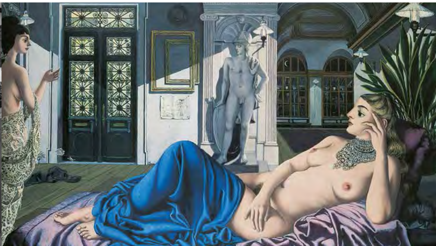
L'éloge de la mélancolie, 1948 | Oil on panel, 153 x 255 cm | Private collection | © Paul Delvaux Foundation, St. Idesbald, Belgium

Je voudrais peindre un tableau fabuleux, dans lequel je vivrais, dans lequel je pourrais vivre.